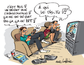
MODULE 1 "L'adolescence, une question de dosage"