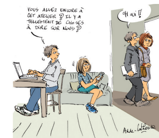
MODULE 2 "L'adolescence, choisissez vos batailles"

POUR PARTICIPER AUX ATELIERS, NOUS CONTACTER AU :